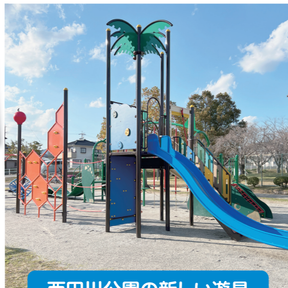
西田川公園の新しい遊具

須田公園の飛行機型のジャングルジム、向山公園のぞうさんのすべり台も建てかえられます。私も小さい頃からたくさん遊びました。