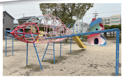
須田公園の飛行機型のジャングルジム

須田公園の飛行機型のジャングルジム、向山公園のぞうさんのすべり台も建てかえられます。私も小さい頃からたくさん遊びました。