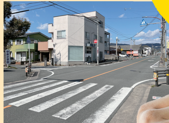
中央小学校周辺の道路や歩道も工事が進められます。

市内の27カ所で実施されます。また、今後の工事のための調査や測量なども実施されます。より安全なまちづくりが進むことを期待したいと思います。