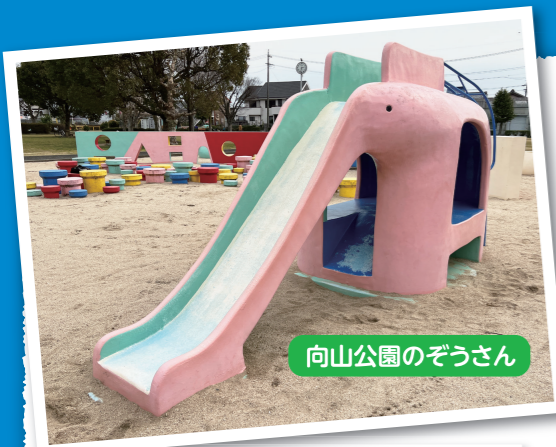
向山公園のぞうさん